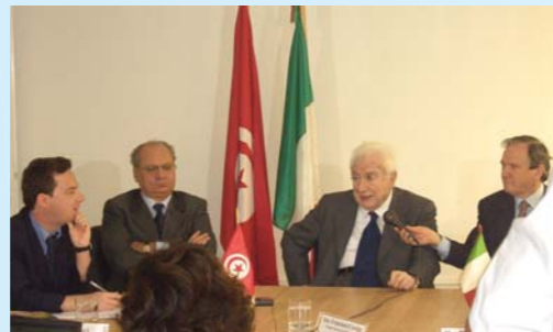
Conferenza stampa nella sala riunioni di Apreime con il Presidente Emerito della Repubblica Sen. Francesco Cossiga e l'Ambasciatore d'Italia a Tunisi. Tunisi, 29/09/2005

Utilizziamo un nucleo di 15 persone che guida, organizza, coordina e gestisce una struttura molto più forte, diffusa nella società tunisina e nei rapporti con la burocrazia.