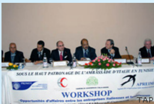
Workshop Aprile 2008 Incontro Imprese