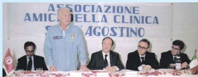
In occasione della partita delle nazionali di calcio Tunisia - Italia del 30/05/2004 l'incontro con la comunità italiana presso la Clinica S. Agostino, da noi organizzato con Giovanni Trapattoni